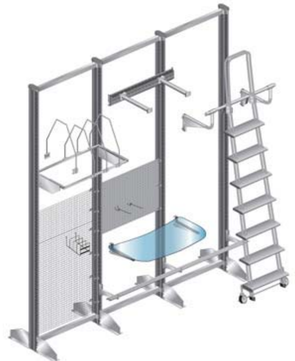
Zubehörteile und Funktionselemente