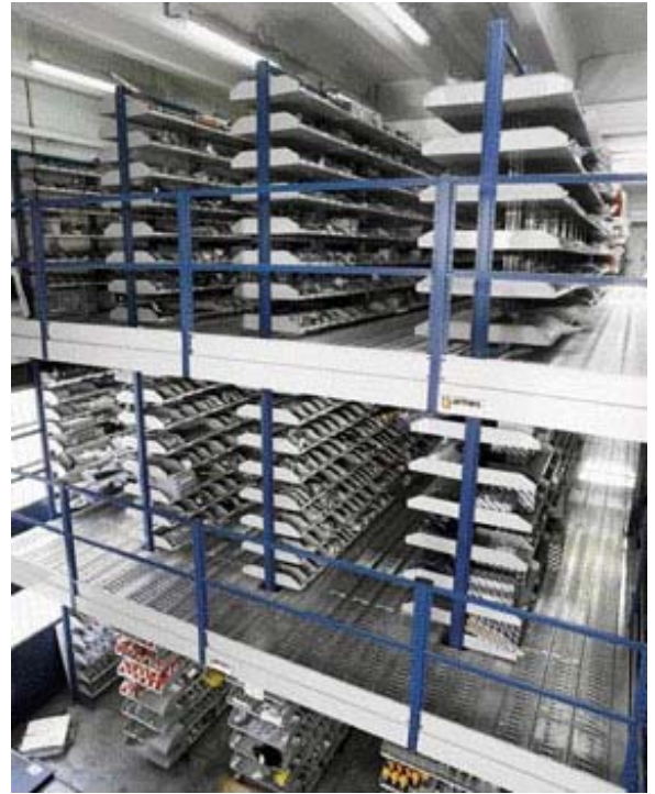
Mehrgeschossige Ausführung mit Zwischenbühnen